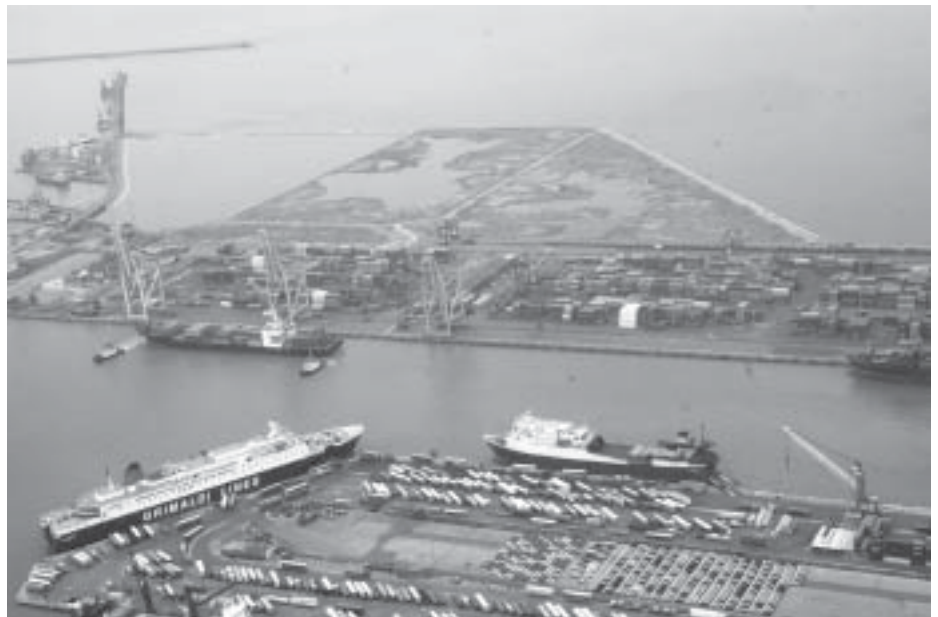
Una veduta aerea della futura Darsena Europa

Per completare la fotografia dell'ex area vasta non resta che da registrare un'importante presenza cantieristica anche a Livorno, e se non si facessero affondare pezzi rilevanti della capacità produttiva, forse se ne vedrebbe di più l'impatto, che comunque resta legato nel lungo periodo alla crescita di competenze, capacità e profili professionali ad hoc di origine locale, o anche quella avrà un radicamento debole. Ad occhio si potrebbe dire che, conclusa la "fase" immobiliare, l'investitore è già in pari rispetto all'esborso dovuto per l'acquisto dell'ex Cantiere e quindi da un punto di vista esclusivamente finanziario