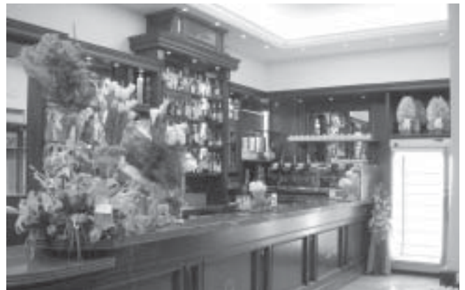
Foto di gruppo dei titolari del Caffè Ginori di Castiglioncello con il personale. A fianco: parte del nuovo arredamento degli interni del locale.