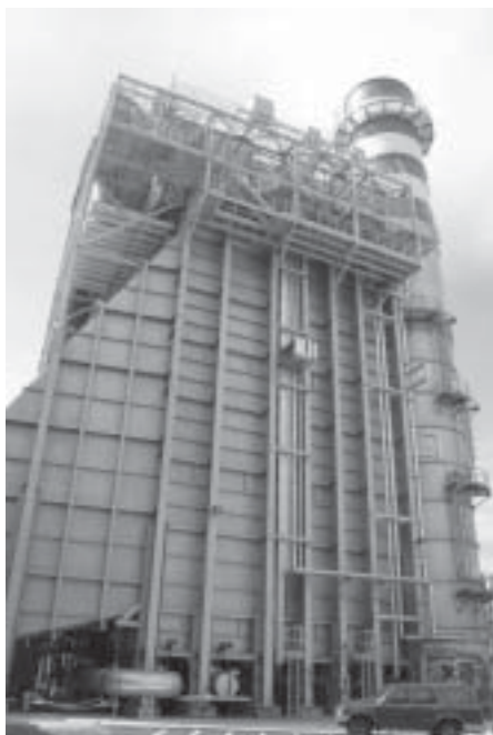
L'impianto della Centrale Turbogas di Rosignano.

Alla cerimonia era presente Valery Andosov presidente di Zirax che è intervenuto esaltando l'importanza dell'accordo e le prospettive future di collaborazione.