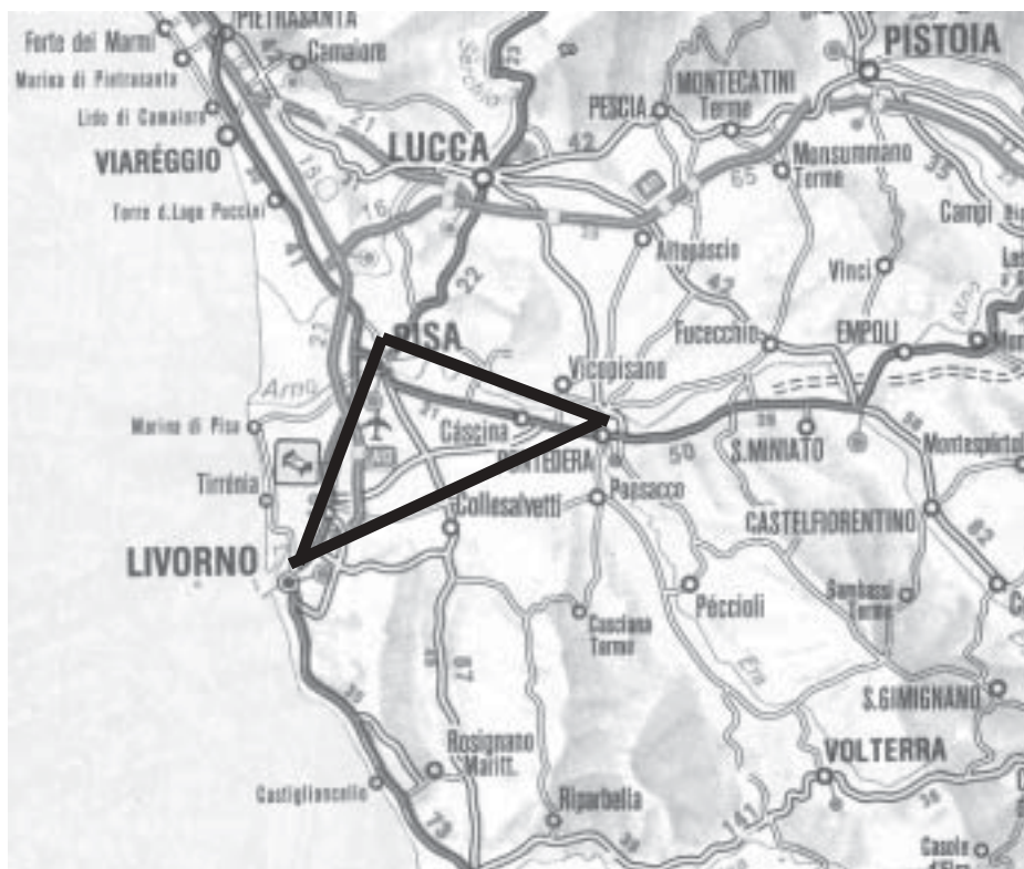
Il famoso "triangolo" Livorno-Pisa-Pontedera dell'Area Vasta