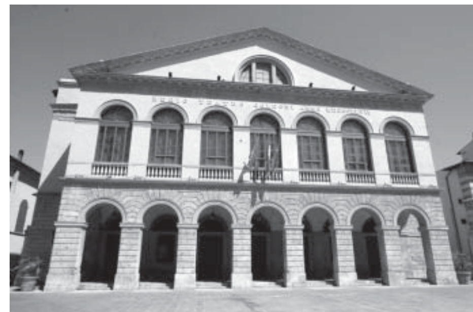
L'esterno del Teatro Goldoni

Pier Paolo Pasolini è stato artista poliedrico e completo, intellettuale e studioso, e la sua scomparsa ha creato un vuoto nella cultura italiana mai più colmato; la Fondazione Teatro Goldoni, nel rilevare come la "Questione Pasolini" sia ben lontana dall'essere conclusa ed archiviata, intende mutuare il suo inquieto spirito di ricerca, il metodo seguito con grande coerenza e lucidità per indagare il teatro italiano, in ogni sua forma e le sue multiformi con-