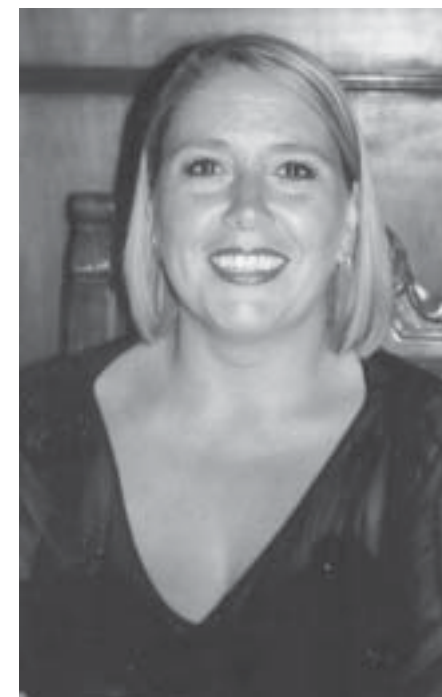
Dunia Del Seppia

Negli ultimi anni il tessuto produttivo del territorio rosignanese è andato verso una sempre maggiore diversificazione. A fianco della grande azienda, infatti, sono nate una serie di piccole e medie attività che ad oggi costituiscono