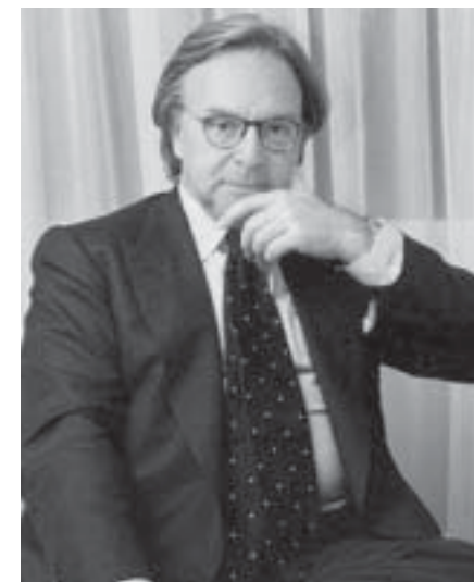
Diego Della Valle