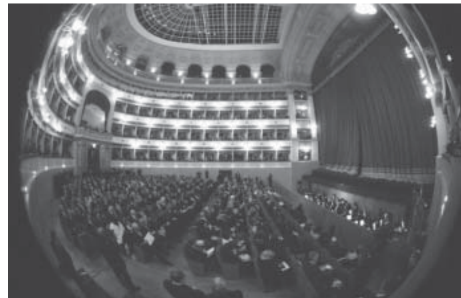
Una caratteristica foto del Teatro Goldoni

La Goldonetta è una novità per tutti, uno strumento eclettico di dialogo e confronto.