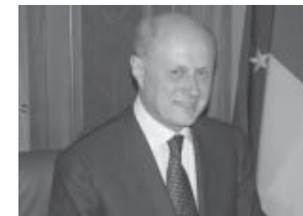
L'on. Bruno Tabacchi

Nel corso di una cerimonia svoltasi a Roma ed organizzata dal quotidiano Il Riformista , l'on. Bruno Tabacchi ha ricevuto "l'OSCAR" quale miglior parlamentare della corrente legislatura.