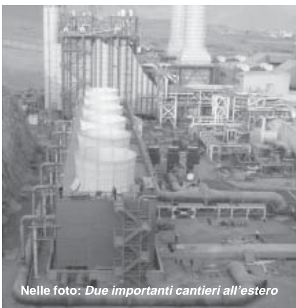
Nelle foto: Due importanti cantieri all'estero

L'apprezzamento dell'Euro rimane fonte di preoccupazione, anche se gli ordini acquisiti nell'ultimo trimestre 2007 consentono al momento una buona programmazione delle attività di S. Luce, in particolare per i grandi diametri, dove la richiesta satura le capacità produttive a breve termine, tanto che si stanno valutando possibili nuovi investimenti per aumentare la capacità produttiva.