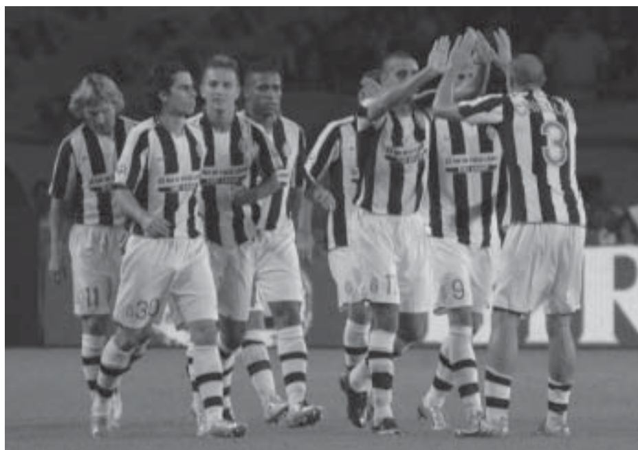
La gioia dei giocatori juventini dopo un gol messo a segno in questa stagione.

raccoglie la storia del dirigente sportivo più vincente e competente di sempre e sono rimasto colpito da una frase: "Difenditi, Luciano!".