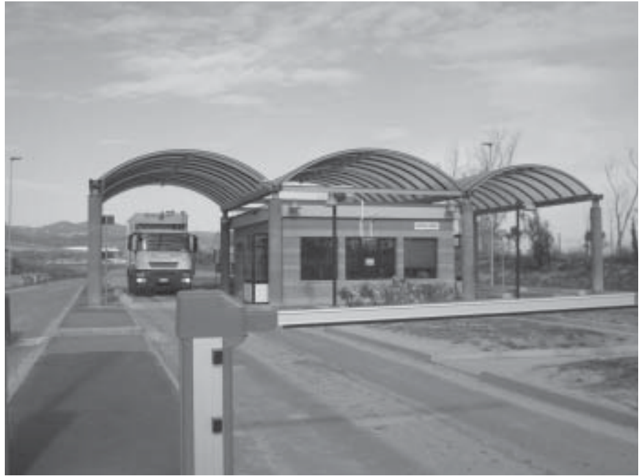
L'area pesa della discarica di Scapigliato.

"La sorte di GETRI, o meglio dell'impianto a Scapigliato per il trattamento dei rifiuti speciali, è stato segnato non