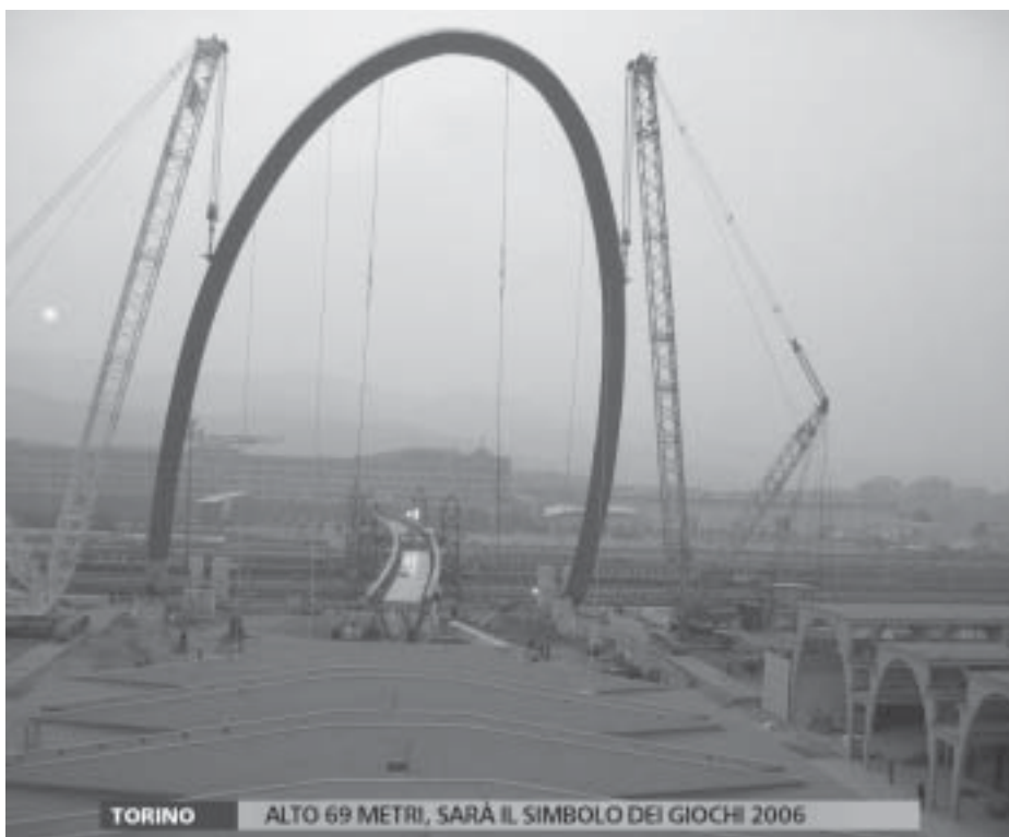
TORINO ALTO 69 METRI, SARÀ IL SIMBOLO DEI GIOCHI 2006

Ci sono voluti 7 mesi di lavoro nelle officine bulgare da dove poi è stato trasferito via mare fino a Savona e da lì con mezzi eccezionali a Torino, dove è stato montato in un solo giorno. Una simile impresa non può che essere di buon auspicio per i nostri Azurri.