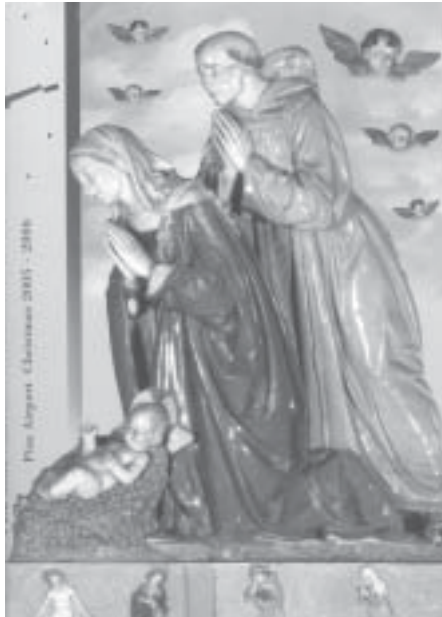
Un particolare del Presepio di Luca della Robbia.

Una curiosità di Barga, ma che coinvolge l'intera comprensorio, è quella di definirsi "the most Scottish town in Italy" questo perché