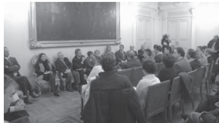
La conferenza stampa svoltasi in Comune nella Sala Cerimonie.

Si sono svolte le consuete conferenze stampa di fine anno del Sindaco e del Presidente della Provincia alla presenza degli assessori dei due Enti.