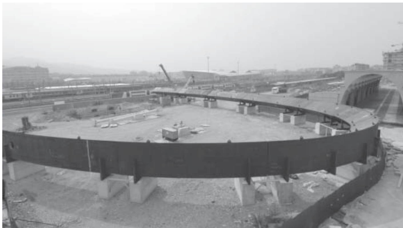
La fase di montaggio e di innalzamento dell'Arco Olimpico di Torino