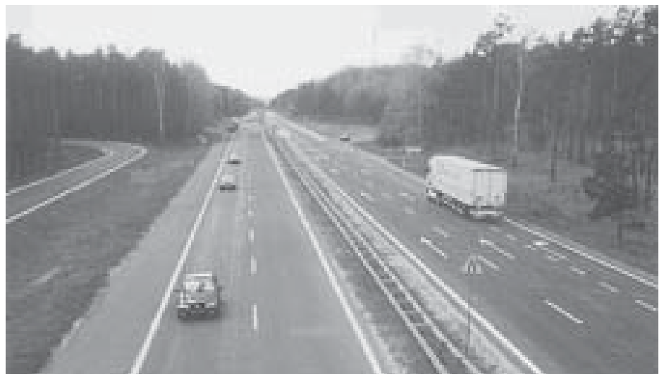
Livorno-Civitavecchia un sogno che dura da trenta anni.