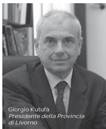
Giorgio Kutufà Presidente della Provincia di Livorno

E sempre a proposito di conferenze stampa, abbiamo partecipato anche a quella convocata dal presidente della Provincia Giorgio Kutufà, alla presenza di tutta la giunta. Dopo la esposizione delle attività svolte dall'organo provinciale da parte del Presidente che ha messo in risalto gli avvenimenti più importanti dell'anno che hanno riguardato l'Ente da lui presidito (lotta alla dispersione scolastica combattuta con una serie di iniziative quali "il contrasto alla dispersione scolastica con azioni che