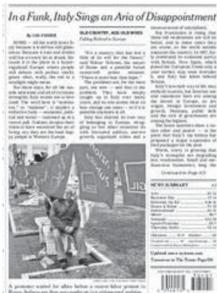
"In Italia regna un'aria di delusione" è il titolo di una corrispondenza da Roma che è apparso in prima pagina sul New York Times dedicata al malessere che affligge il nostro paese.

Abbiamo un governo di solidarietà nazionale che a differenza di trent'anni fa non è monocoloro, ma più variegato del vestito di Arlecchino e all'opposizione ci sono quelli che con il faccendiere di Arezzo misero su un progetto di "rinascita democratica" che mirava a far fuori DC e PCI a rimettere nell'area di governo la destra (nacque nel 1978 Democrazia Nazionale, antenata della più fortunata Alleanza Nazionale di Fini). Trent'anni fa nasceva Gigi Buffon, oggi acclamato campione del mondo e neo