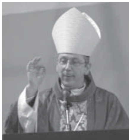
Mons. Simone Giusti

“Questo incontro – ha detto Monsignor Giusti – è l'occasione per fare una prima conoscenza e per ascoltare da voi alcune indicazioni sulla città. Mi piacerebbe che avessimo alcuni obiettivi comuni come i giovani, i poveri, la democrazia. E che lavorassimo insieme, perché attraverso alcune iniziative possiamo educare i giovani alla vita politica, trasmettere loro il senso della nazione, dell'unità; perché feste come il 25 aprile e il 2 giugno raggiungano il cuore anche dei più piccoli ed il senso della cittadinanza possa diventare davvero un valore