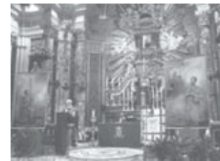
Il Santuario di Montenero

L'artista ha creato l'opera pittorica della figura di San Disma che è stata al centro della celebrazione ed ha così "dato un volto" a quello che, come sappiamo dal Vangelo di San Luca (23, 39-43), è stato canonizzato per bocca stessa di Gesù sulla croce. Durante la stessa cerimonia è stata esposta sull'altare anche un'altra opera della pittrice: San Longino, il centurione romano che squarciò il costato di Gesù. Le due grandi tele sono state collocate, dopo la cerimonia, una a destra e una a sinistra del grande Crocifisso ligneo nell'omonima cappella.