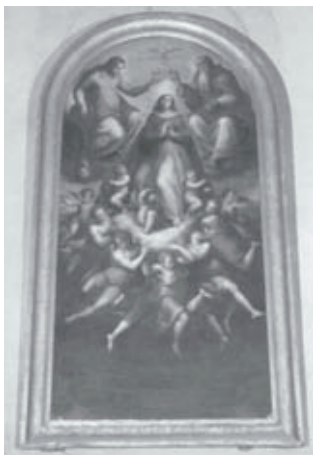
L'Assunzione di Maria incoronata dal Padre e dal Figlio di Giorgio Vasari