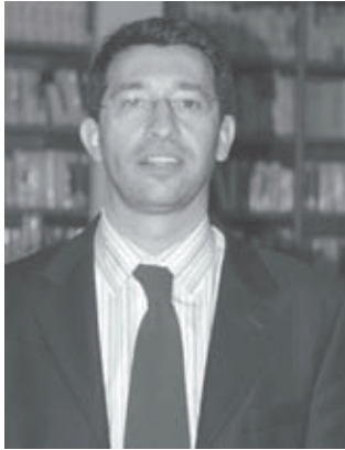
Il Sen. Marco Filippi

Ritengo non sia più procrastinabile una riforma costituzionale dello Stato in senso regionale e federalista e che veda, proprio nel Senato, un Senato delle Regioni, la grande opportunità di trasformare l'attuale sistema mettendolo finalmente in collegamento con i territori alla luce soprattutto della già avvenuta riforma