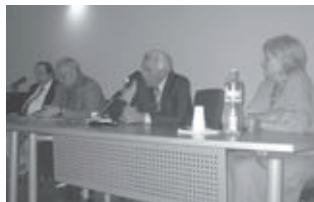
Un momento dell'incontro a ricordo della figura di Don Giovanni Nardini

L'ex cinema di Via dei Lavoratori a Rosignano Marittimo ha finalmente riaperto i battenti, dopo anni di inutilizzo, ristrutturato e trasformato in una sala perfettamente attrezzata, luogo ideale per incontri, manifestazioni, spettacoli.