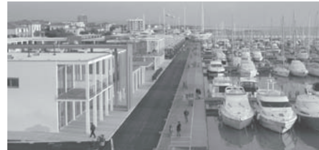
Una veduta del complesso Marina Cala de' Medici