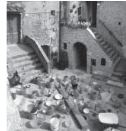
DUBRAVKA VIDOVIC:Kisa, 2005 - installazione a Casale Marittimo per la manifestazione 'Strade bianche'.

SABATO 29 LUGLIO 2006 18.30 inaugurazione della mostra e presen-