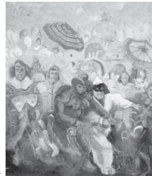
Due opere di Mauro Balzini: a destra: Carnevale a Venezia, 60x70; sotto: Famiglia in campagna, 70x50.