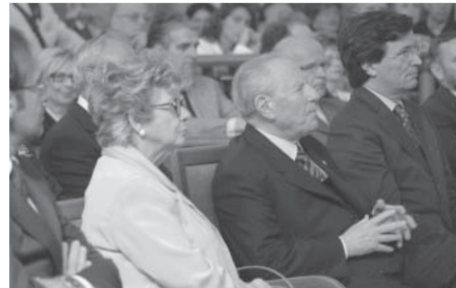
La Signora Franca e il Presidente Carlo Azeglio Ciampi in Consiglio Comunale

La mattina del 3 maggio, mentre il Presidente stava uscendo dalla Sala del Consiglio Comunale, circondato dalle forze dell'ordine, ma