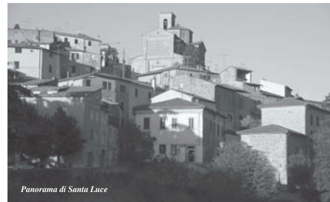
Panorama di Santa Luce