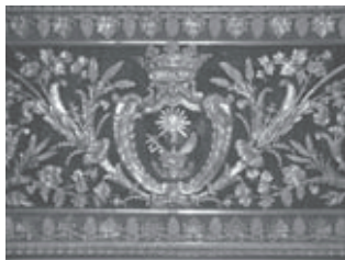
Particolare del paliotto Santa Giulia.

- una antica immagine di S. Giulia , da-