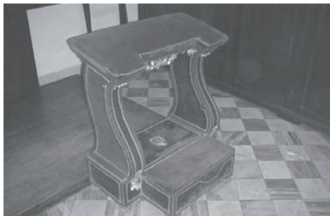
L'ingnocchiatoio utilizzato dal papa Pio IX nel momento della preghiera nell'oratorio dell'Arciconfraternita in occasione della visita a Livorno il 25 agosto 1857

La visita inizia al piano terreno, nell'attuale Sagrestia , e prosegue al primo piano nei locali della Sala Magistrale , ancora oggi utilizzata per le attività confraternali, e della Sala degli Arredi , un tempo riservata ai confratelli sagrestani per la custodia degli oggetti ad uso liturgico.