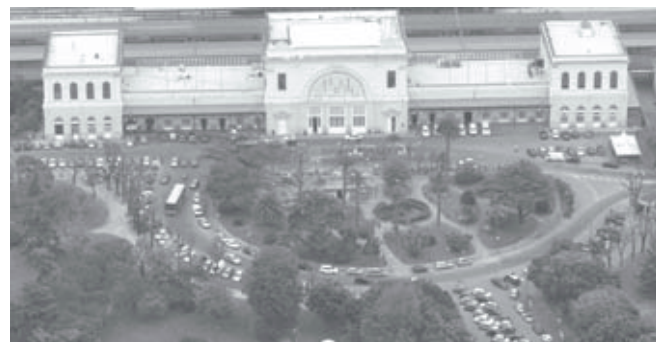
Nella foto di Roberto Onorati ecco come si presenta l'area della Stazione dopo l'abbattimento della fatiscante baracchina una volta adibita a bar.

Finalmente distrutta la fatiscante baracchina nei pressi della Stazione Centrale