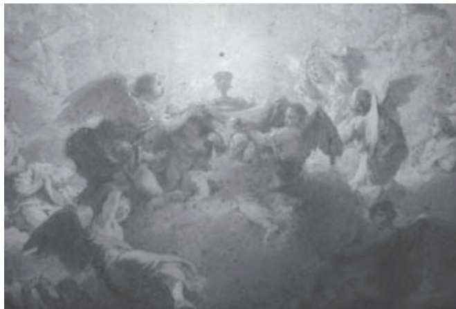
Particolare del bozzetto dell'affresco "Trionfo dell'Eucarestia", di Giuseppe Maria Terreni, importante testimonianza dell'affresco realizzato nel 1791.

- Alcuni arredi sacri , datati tra il XVI e il XIX secolo, tra cui crocifissi, calici, pissidi, vassoi, reliquiari, aspersori, navicelle, patene, candelieri, secchielli e molto altro.