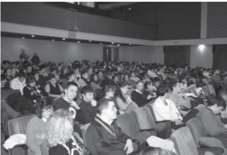
La folta platea di studenti al Teatro E. Solvay durante il dibattito su Enrico Mattei.

Un grande italiano, un protagonista assoluto della storia del nostro paese del secolo XX che, purtroppo, non ha avuto, a tutt'oggi, la considerazione ed i riconoscimenti che avrebbe meritato.