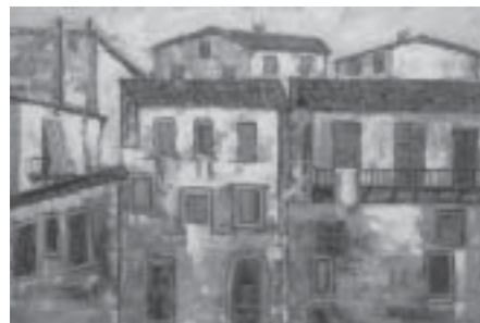
Un'opera di Fabrizio Lucarelli

Numerosi sono i premi e riconoscimenti ricevuti da Lucarelli. Nel 1974 ha ricevuto il titolo di accademico benemerito dall'Accademia Univer-