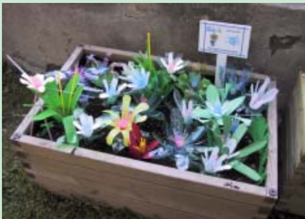
Fiori realizzati con bottiglie e flaconi

Tra le attività educative di Rosignano Energia Ambiente S.p.A ci sono anche le visite agli impianti di smaltimento presenti nell'area di Scapigliato. Numerose sono infatti le scolaresche che prendono parte alle visite guidate all'interno della discarica, osservando dal vivo i metodi di smaltimento.