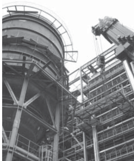
Impianto di termovalorizzatore

In questo quadro, limitare il potenziamento dell'impiantistica ad un solo rigassificatore risulta incoerente con le