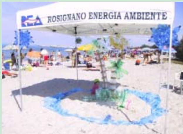
Educazione ambientale sulle spiagge

Per le scuole materne i progetti principali sono "La dottoressa Azzeccarifiuti", gioco che inscena un intervento medico a un globo ormai malato e invaso dai rifiuti, la "Festa di