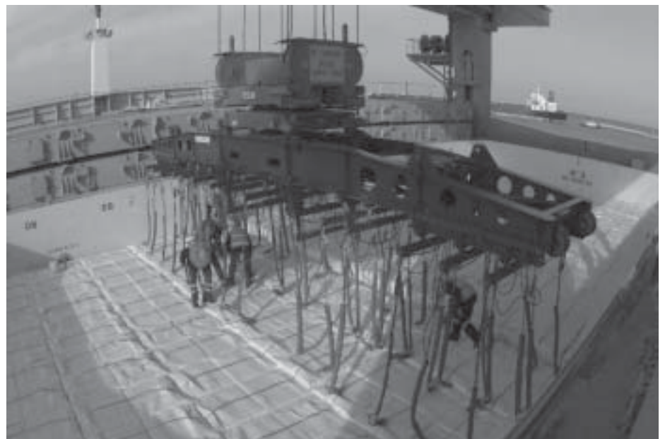
Un carico di cellulosa

Il ruolo del terminal nel sistema dell'alto Tirreno è un ruolo sicuramente importante e centrale, molto dipende da come si svilupperà il porto sul tema dei fondali, soprattutto del canale di accesso, l'affondamento del subalveo dei tubi Eni, dell'allargamento della bocca sud, dei collegamenti logistici e ferroviari verso i centri di smistamento delle merci, del completamento del fascio dei binari all'interno del terminal, ma la sfida vera per attrarre i traffici del prossimo decennio è la realizzazione della piattaforma Europa, già oggi oltre l'80% delle merci viaggia negli scatoloni e la percentuale nel prossimo decennio, soprattutto nel mediterraneo, è destinata ad aumentare vertiginosamente, non esserci significa non avere prospettiva e futuro e rischiare di diventare un porto declassato.