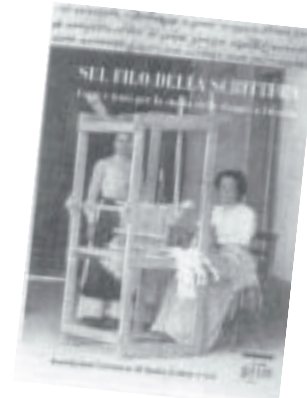
La copertina del volume Sul filo della scrittura

Non è forse S. Giulia (VIII° secolo) la sua patrona? E non è la Madonna di Montenero (XIV° secolo) la protettrice dell'intera Toscana? Due archetipi ideali di donna a cui fanno da contraltare le trasgressive e le eretiche (vedi la Masina di Liburno arsa viva su una galea lungo l'Arno nella seconda metà del Trecento).