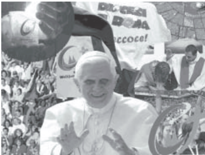
Il Papa Benedetto XVI alla Giornata Mondiale della Gioventù a Colonia

Tuttavia, quando Benedetto XVI ha lanciato la sfida per Sidney 2008, tutti l'hanno accolta calorosamente. Sono ancora vivi dentro di noi i ricordi dei momenti più belli e sempre più lontane le difficoltà incontrate ogni giorno a causa dei problemi