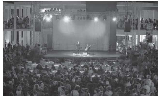
Una delle numerose manifestazioni collaterali svoltesi all'interno di Cala de' Medici.