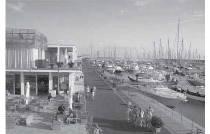
Parziale veduta del Porto cala de' Medici

Dobbiamo inoltre considerare le iniziative che si affacciano sulla Piazza e che ruotano intorno alle strutture del Borgo: dalla ristorazione, alle attività commerciali, dai concerti, agli spettacoli, alla presentazione dei libri, alle manifestazioni enogastronomiche: Un calendario di appuntamenti ha animato il Porto del