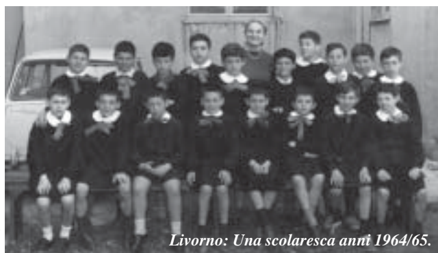
Livorno: Una scolaresca anni 1964/65.