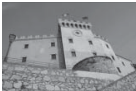
Il Castello

Purtroppo l'arch. Milanese è venuto meno nel 2004 e non ha avuto la possibilità di vedere completata "la sua creatura" ma il Suo contributo resta fondamentale.