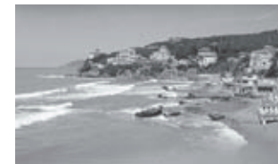
Una veduta di Castiglioncello