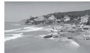
Una veduta di Castiglioncello