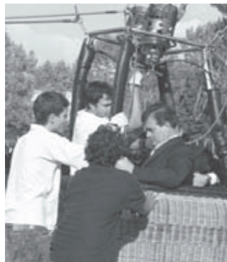
Il Presidente Polzella a bordo della mongolfiera per "volare sempre più in alto".

Quello che vogliamo sottolineare con forza è l'obiettivo che il Presidente si è proposto: non solo il rilancio della prima squadra verso la conquista di ambiziosi traguardi da raggiungere nel giro di due o tre anni ma l'impegno e l'interesse verso i giovani che, attraverso il calcio, interpretato in maniera seria e corretta, svolto in un ambiente "sano"