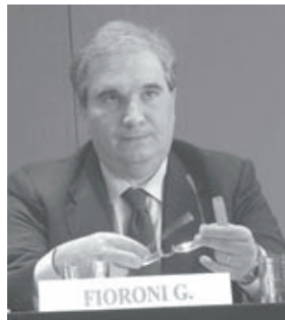
Il Ministro Fioroni.