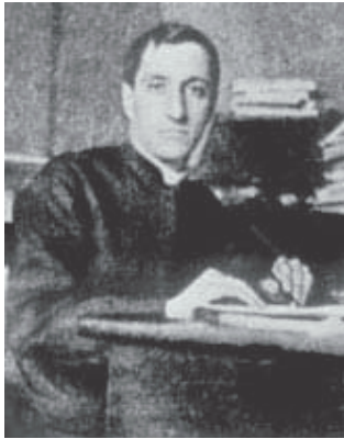
Don Luigi Sturzo (1871-1959)

"Oggi si può dire che è tassata anche l'aria che si respira. E' una linea sba-