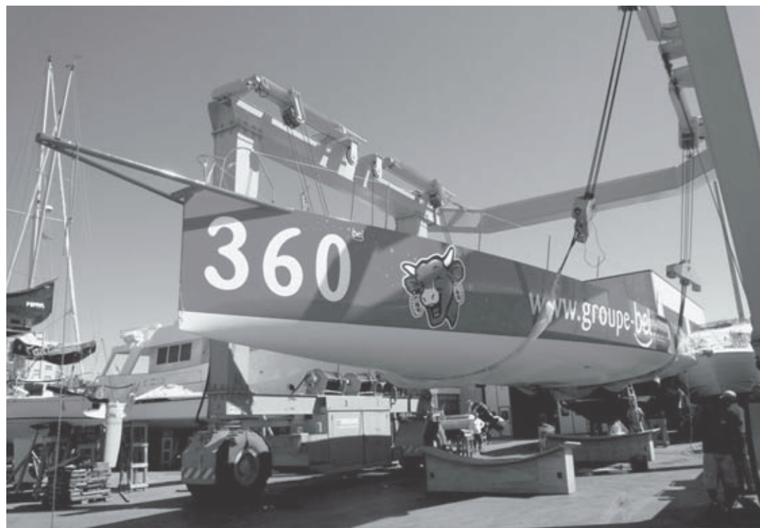
L'Imoca 60 "BEL" prima del varo all'interno del Cantiere Cala de' Medici di Rosignano Solvay

Essendo un prototipo l'area del Cantiere, con le sue officine ed attrezzature, rimane la più idonea per effettuare un'alberatura dove in caso di imprevisto la reattività per la sua risoluzione è im-